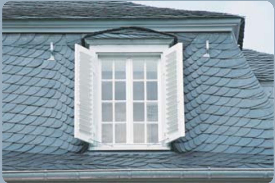
Die ausgehend gedeckten Wangenkehlen sind einerseits mit kleinen Schwärmern, andererseits mit decksteinähnlichen Kehlübergangsteinen an die Deckgebilde der Mansarddachfläche angeschlossen.

Die Sanierung erfolgte aufgrund einer gutachterlichen Schadensanalyse