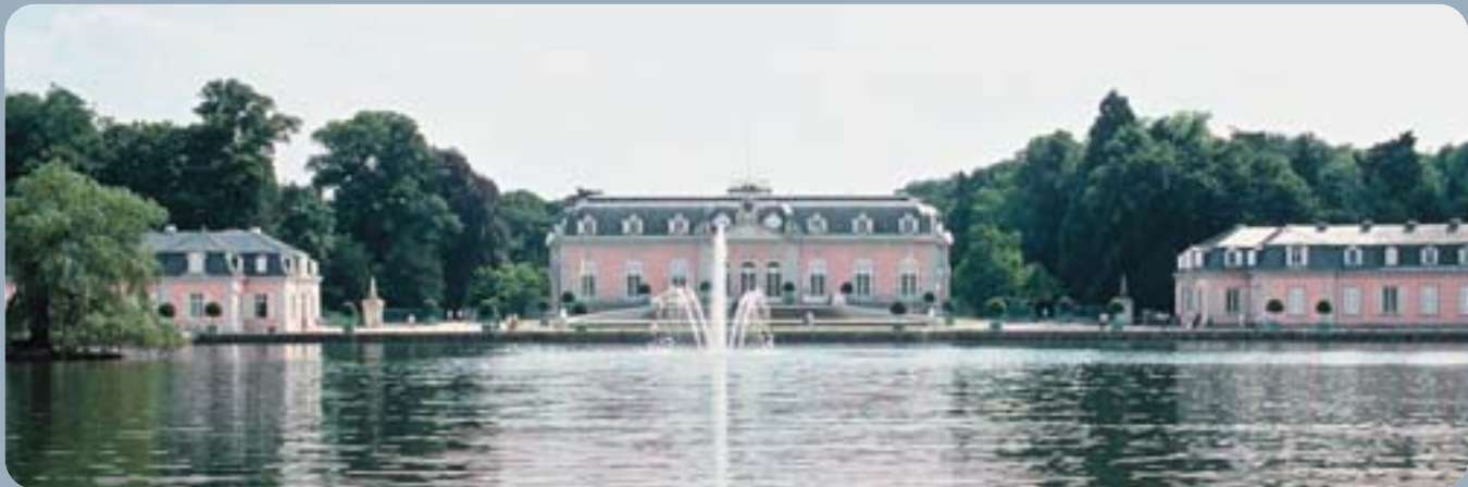
Blick auf das im 18. Jahrhundert entstandene Schloss Benrath bei Düsseldorf.

Im Jahre 1755 wurde der Oberbaudirektor Nicolas de Pigage beauftragt, südlich von Düsseldorf, nahe dem heutigen Benrath, eine ländliche Residenz für fürstlichen Lebensstil zu errichten.