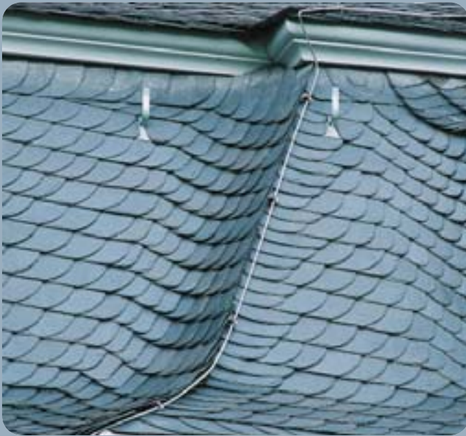
Detaillierung des Mansarddaches. Linke Hauptkehle und ausgehende Wangenkehle.

zugeschnitten. Das einzelne Kehlblech ist an der oberen Schmiede etwa 18 cm und an der unteren etwa 8 cm breit. Durch den stark konischen Zuschnitt hebt sich das Kehlblech von unten nach oben zunehmend aus dem Kehlwinkel heraus. Die Kehlsteine finden von einem Kehlgebände zum nächsten zunehmend Holz unter dem Kopf, liegen stets flacher als das Kehlblech und müssen deshalb im Kopf nicht unterlegt werden. Infolge des am unteren Ende sehr schmalen konischen Kehlblechtes ist die sich aus der Schrägstellung des Kehlblechtes neben dem Kehlansfang ergebende dreieckige Öffnung unauffällig klein.