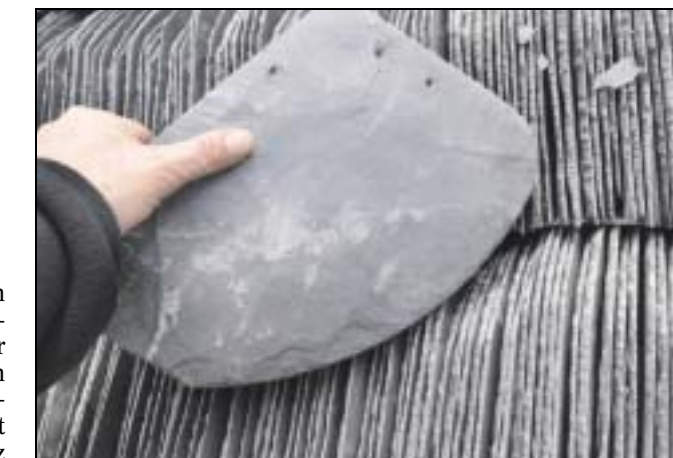
Heutzutage treffen die Schiefersteine von der Mosel vorgefertigt auf der Baustelle ein.

er an dem viereckigen Turm einen Schieferstein mit dem Bogen auf der rechten oder der linken Seite.