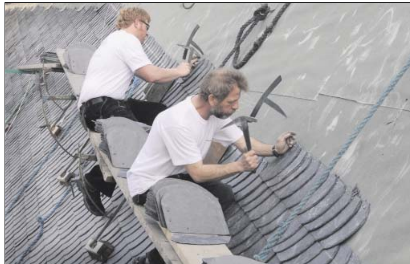
Drei, zwei eins, drin: Jeder Schieferstein wird mindestens mit drei Nägeln befestigt. Etwa 40 Steine bedecken einen Quadratmeter Dach.