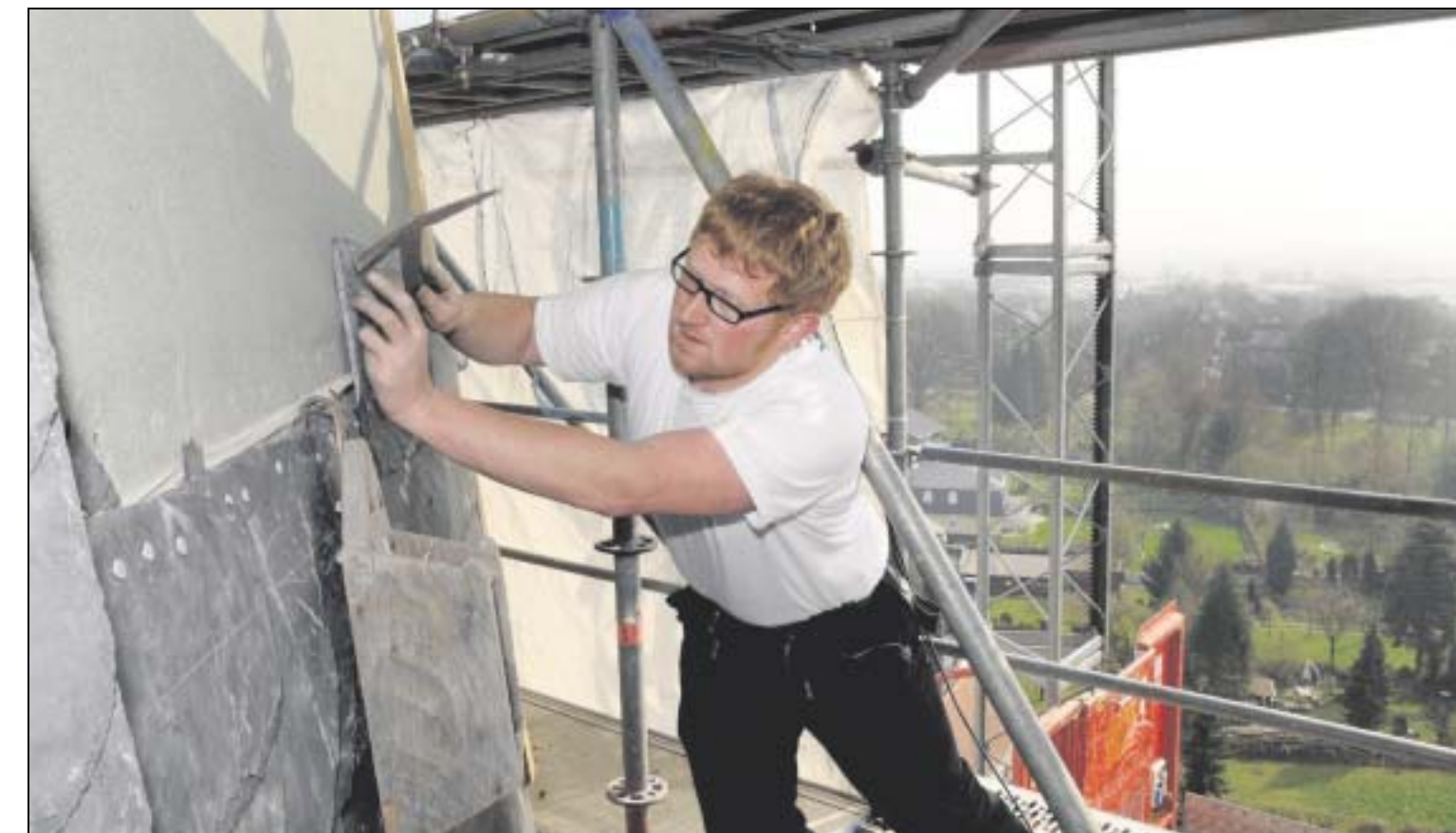
Dachdecker - heute noch ein Beruf mit guten Aussichten.